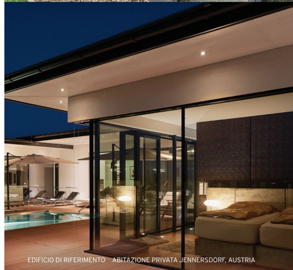
EDIFICIO DI RIFERIMENTO - ABITAZIONE PRIVATA JENNERSDORF, AUSTRIA